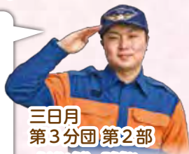
三日月 第3分団 第2部

消防団員の両親の勧めで入りました。まだ火事の現場は出ていませんが、土生遺跡の文化財防火訓練に参加しました。皆さん優しく、月1の活動も行ける人が行くという感じなので負担にもならないです。友達にも自分の地域の消防団に入ってほしいですね!