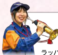
勇壮な音色を奏でる 女性初のラッパ隊!

ラッパ隊に所属している上司から誘われて入団しました。ラッパにはピストンがなく、口の動きで音階を調節するのが難しかったのですが、皆さん明るくて優しく教えてもらっています。