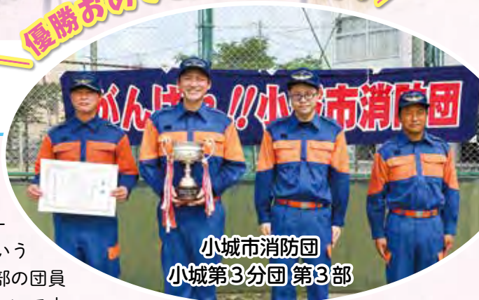
小城市消防団 小城第3分団 第3部

地域のいろいろな年代の人とつながりがもてるのも消防団の魅力です。ぜひ私たちと一緒に地域の安全・安心を守りましょう!